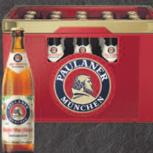
Paulaner Hefe-Weißbier Naturtrüb, Alkoholfrei und weitere Sorten, Kiste mit 20 x 0,5-L-Flaschen zzgl. 3,10 € Pfand (1 L = € 1,40)