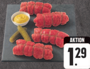
Rinderrouladen 100 g