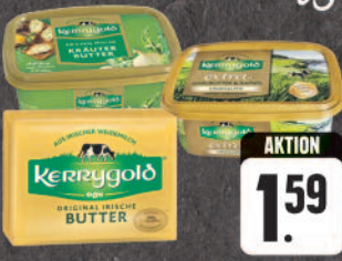
Kerrygold original irische Butter auch extra gesalzen oder unge- salzen 250 g (1 kg = € 6,36) oder Kräuter Butter 150 g (1 kg = € 10,60), Packung/Becher