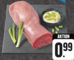
Rinderzunge gepökelt, 100 g