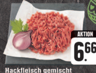
Hackfleisch gemischt aus Schweine- und Rindfleisch, laufend frisch hergestellt, 1 kg