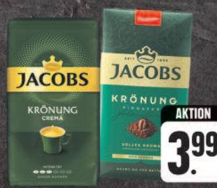
Jacobs Krönung vakuum gemahlen oder ganze Bohnen, verschiedene Sorten, 500-g-Packung (1 kg = € 7,98)