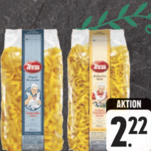
Tress Original Hausmacher oder Großmutter's Küche Teig- waren verschiedene Ausformungen, 500-g-Packung (1 kg = € 4,44)