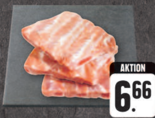
Frische Schälrippchen 1 kg