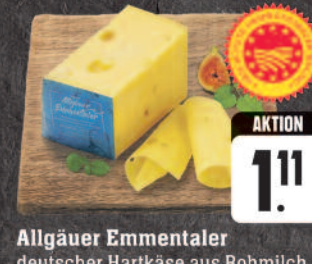
Allgäuer Emmentaler deutscher Hartkäse aus Rohmilch, mind. 45% Fett i. Tr., mind. 3 Monate gereift, vollmundig, nussig, 100 g