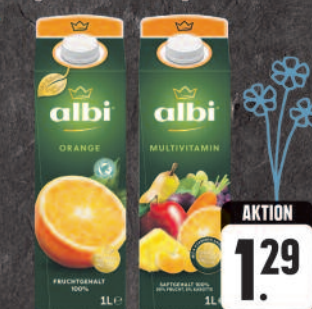
Albi Saft aus Konzentrat oder Nektar verschiedene Sorten, 1-L-Packung