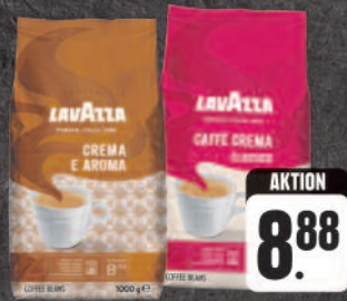
Lavazza Crema e Aroma, Caffè Crema Classico und weitere Sorten, ganze Bohnen, 1-kg-Packung