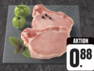
Frisch gekochte Rippen 100 g