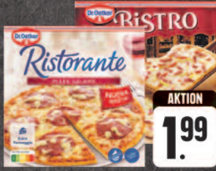
Dr. Oetker Pizza Ristorante oder Bistro Flammkuchen verschiedene Sorten, z. B. Pizza Salame 320 g (1 kg = € 6,22), tiefgefroren, Packung