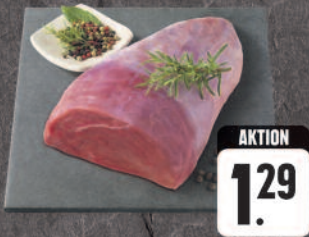
Rinderbraten aus der Keule, 100 g